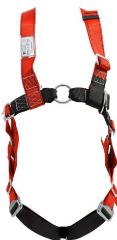
Abb. MB30 Vorderseite

gepr. nach EN 361:2002 (und EN 1497:2007 in der Var. MB30-R)