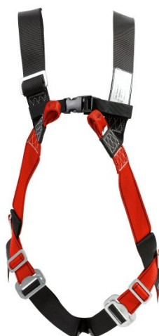
Abb. MB30-2T Vorderseite